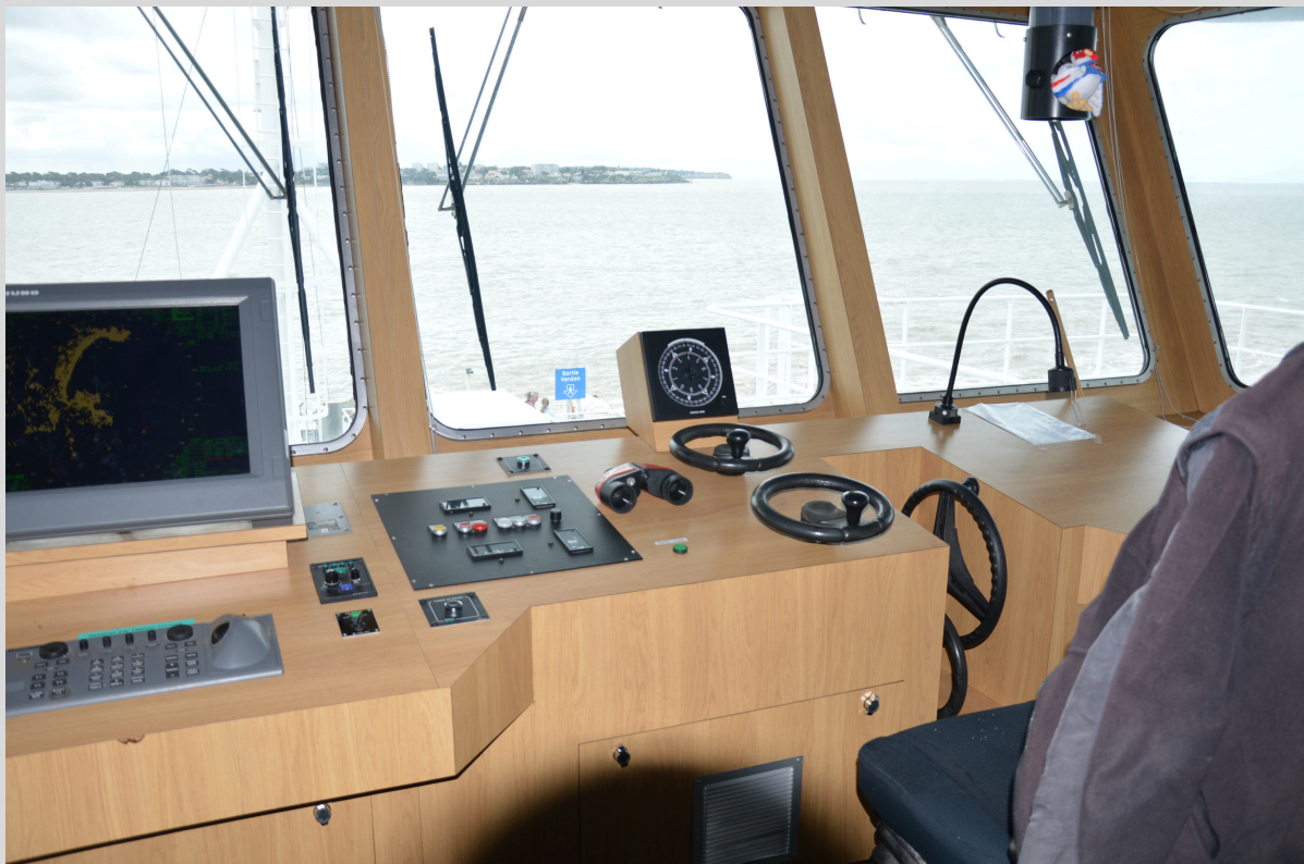
PHOTOS DU BAC